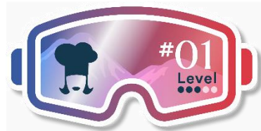
Die verschwundene Köchin