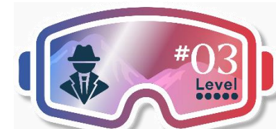
Alles oder Nichts