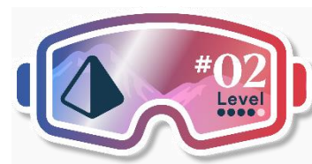
Fluch des Prismas